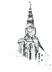
Kościół pw. Św. Stanisława i Św. Wacława Katedra Diecezji Świdnickiej

Proszę o uzupełnienie porządku obrad XXXVI sesji Rady Miejskiej Świdnicy o projekt uchwały w sprawie przystąpienia do prac nad strategią rozwoju społeczno-gospodarczego południowej części Dolnego Śląska, „SUDETY 2030”.